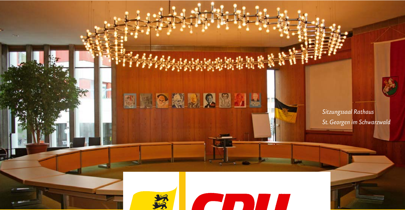
Sitzungssaal Rathaus St. Georgen im Schwarzwald